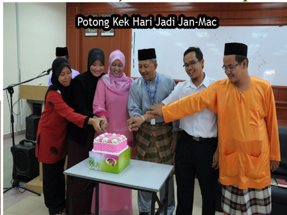
Potong Kek Hari Jadi Jan-Mac

Majlis Portluck telah diadakan di Bilik Seminar KKBP pada 11 Jun 2010 yang lalu. Seramai lebih kurang 40 orang ahli Bakat telah hadir bagi meraikan dan menjalin ukhuwah sesama ahli Bakat. Majlis telah dirasmikan dengan ucapan alu-aluan oleh tuan pengarah. Majlis juga meraikan ahli bakat yang menyambut hari kelahiran, perkahwinan dan menerima cahaya mata. Majlis diakhiri dengan jamuan makan yang disediakan oleh sesama ahli bakat