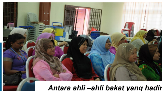
Antara ahli-ahli bakat yang hadir