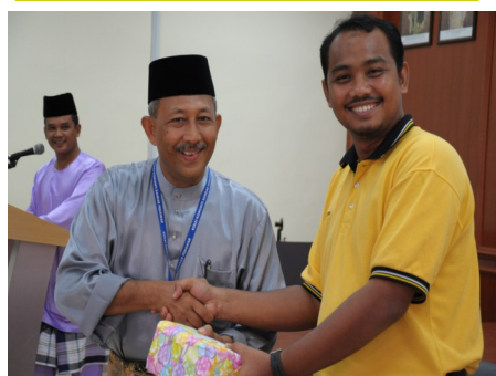
Antara staf yang menerima hadiah hari lahir

Majlis Portluck telah diadakan di Bilik Seminar KKBP pada 11 Jun 2010 yang lalu. Seramai lebih kurang 40 orang ahli Bakat telah hadir bagi meraikan dan menjalin ukhuwah sesama ahli Bakat. Majlis telah dirasmikan dengan ucapan alu-aluan oleh tuan pengarah. Majlis juga meraikan ahli bakat yang menyambut hari kelahiran, perkahwinan dan menerima cahaya mata. Majlis diakhiri dengan jamuan makan yang disediakan oleh sesama ahli bakat