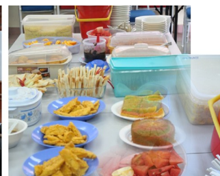
Antara Juadah yang dihidangkan